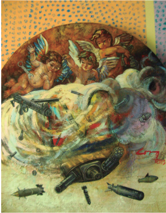
Después de los 14 Mixta sobre MDF, 120 x 106 cm.