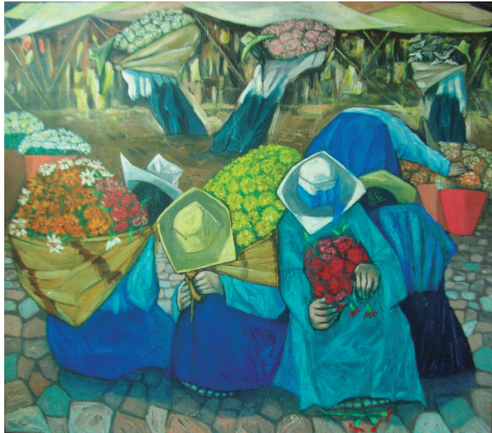
Mercado de flores Óleo sobre lienzo, 150 x 130 cm.