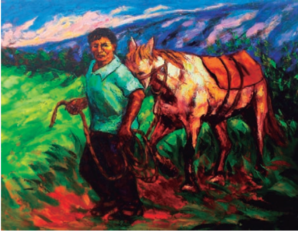
El retorno Óleo sobre lienzo, 150 x 115 cm.