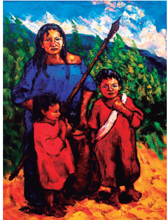
Vigilia II Óleo sobre lienzo, 120 x 92 cm.