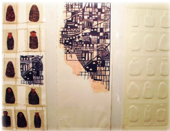
Desterradas (tríptico) Técnica mixta 115 x 80 cm.