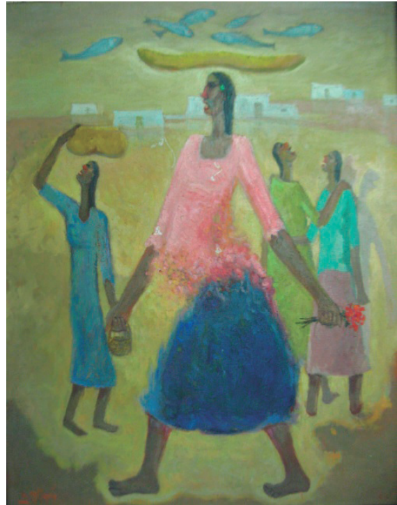
Canción Mochica Óleo sobre lienzo, 70.5 x 55.5 cm.