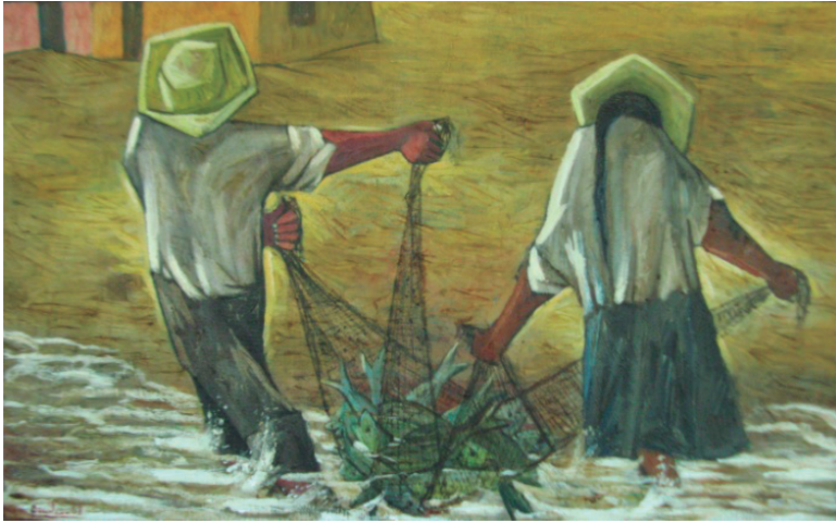
La red Óleo sobre lienzo, 80 x 130 cm.