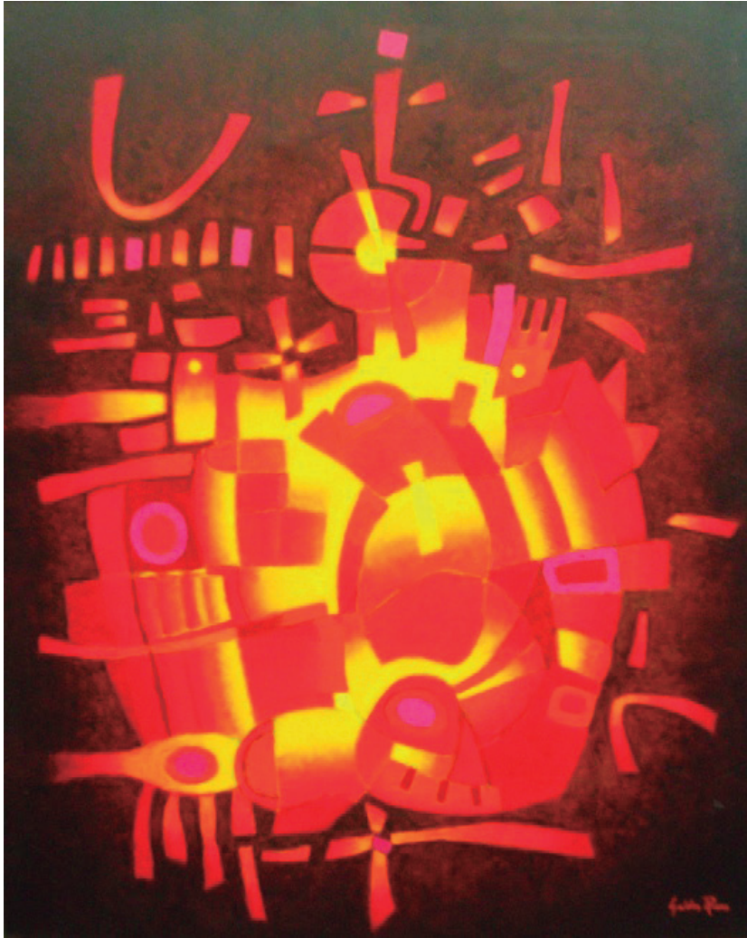
Divertimento con luz y fuego Óleo sobre lienzo, 100.5 x 81 cm.