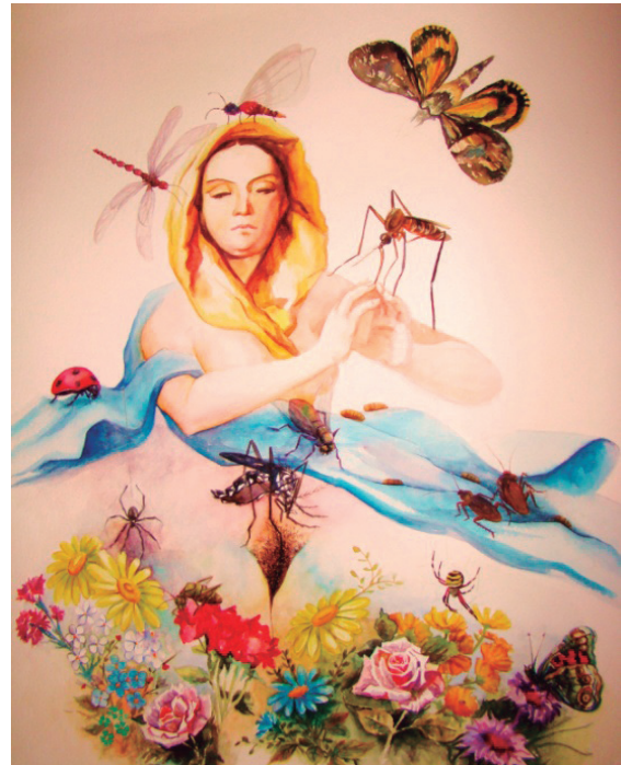
La virgen atomizada por Cora Acuarela, 75 x 56 cm.