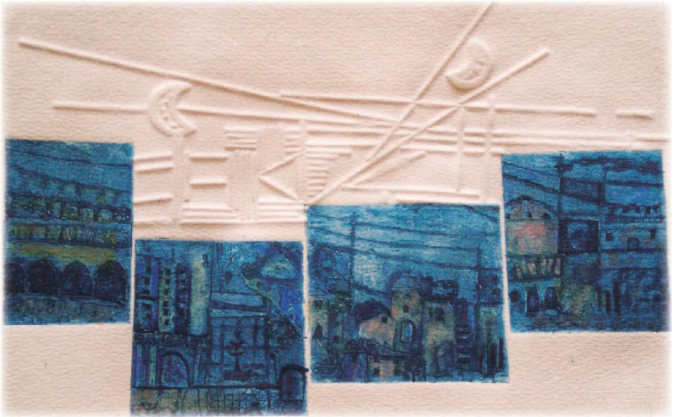
Nocturnos Técnica mixta, 50 x 60 cm.