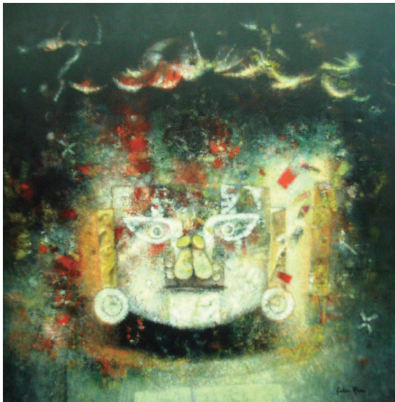
Soñando con el ancestro andino Óleo sobre lienzo 120 x 120 cm.