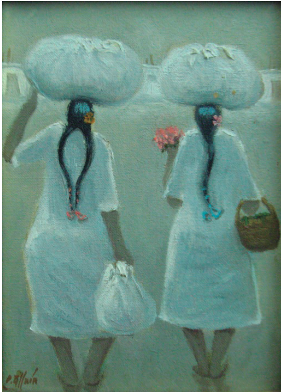
Lavanderas Óleo sobre lienzo, 22 x 16 cm.