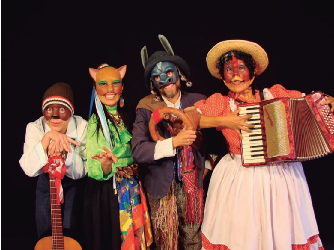
Los músicos ambulantes