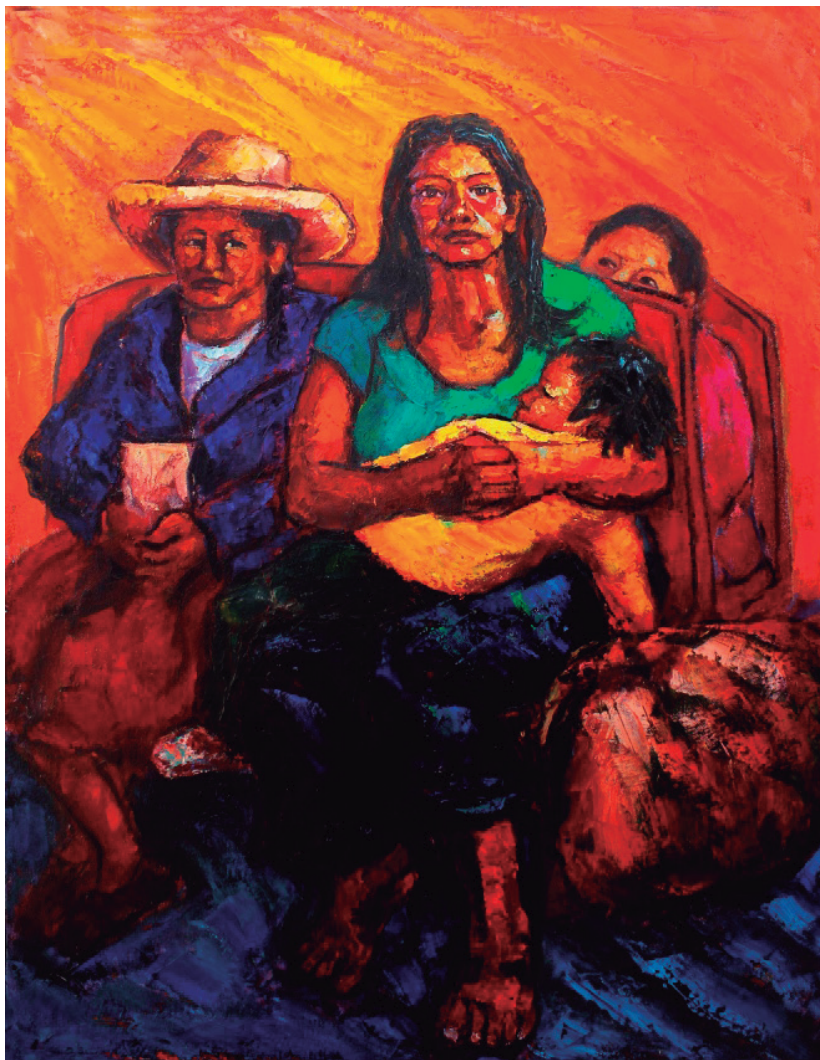
Madre Óleo sobre lienzo, 120 x 92 cm.