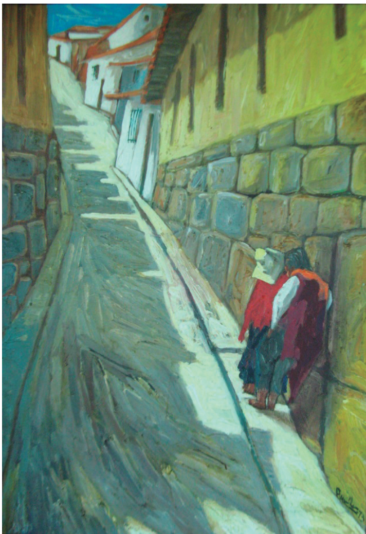
Calleja Óleo sobre lienzo, 98 x 68 cm.