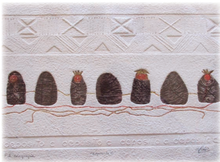
Depósito c Técnica mixta, 80 x 130 cm.