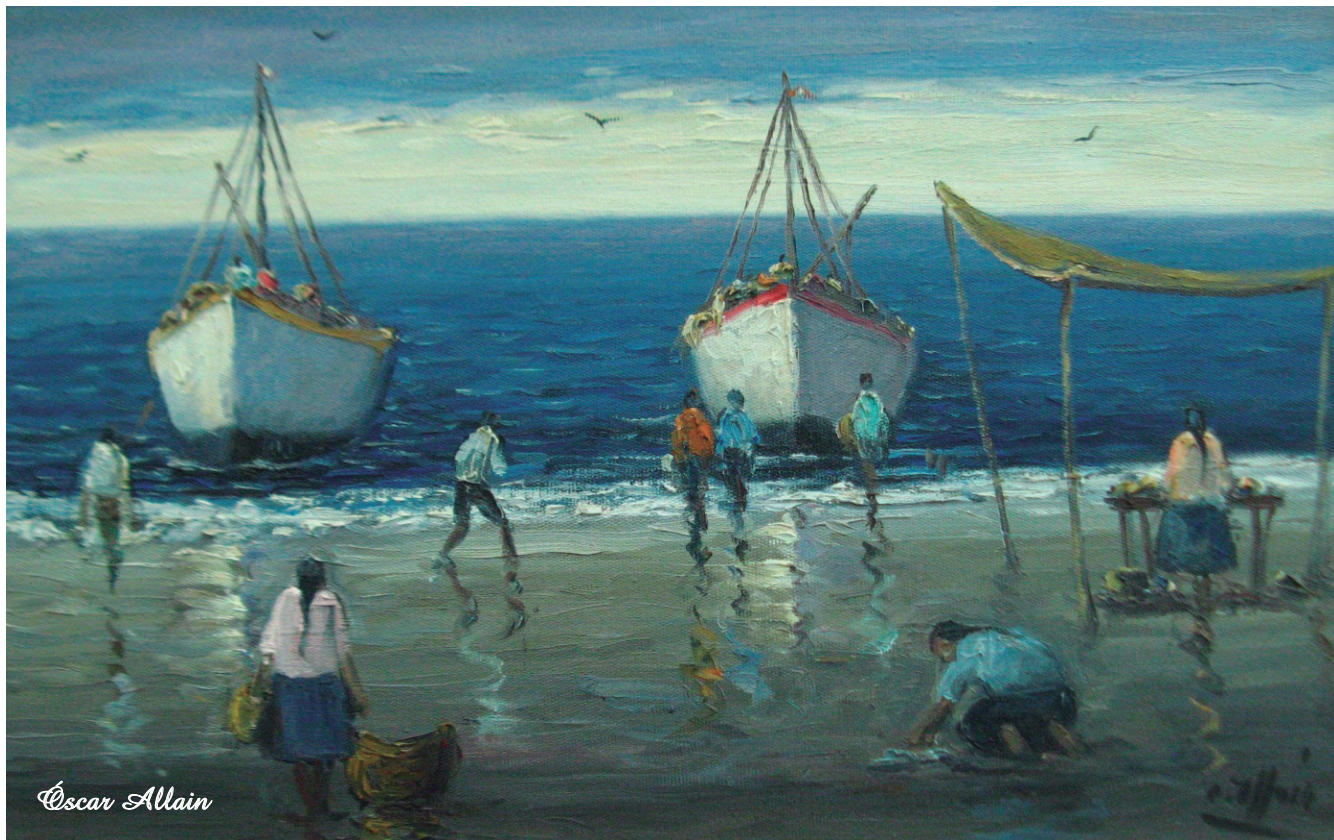
Marina norteña Óleo sobre lienzo 35 x 55 cm.