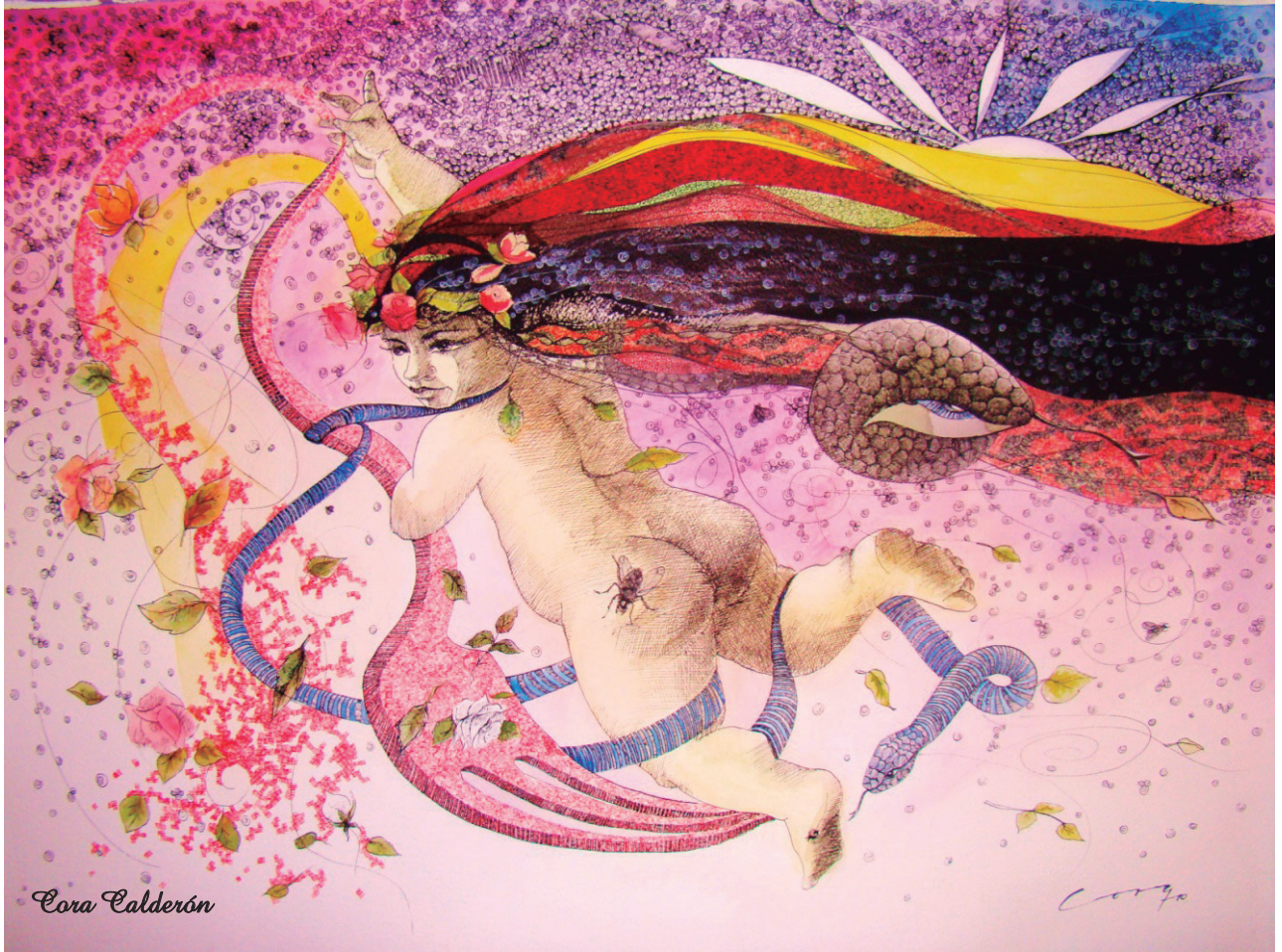
Santa Rosa ya lo sabe Dibujo a tinta, 75 x 56 cm.