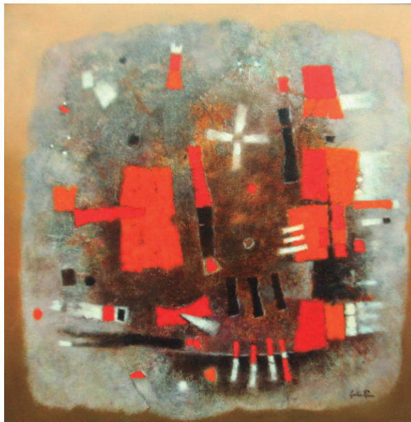
Lápida Cromática Óleo sobre lienzo 90 x 90 cm.