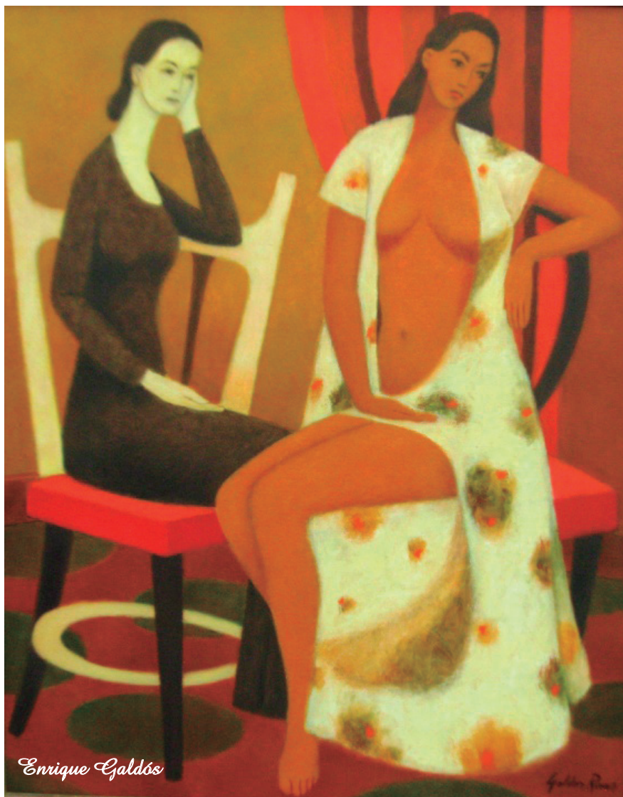
Recuerdo de Bellas Artes Óleo sobre lienzo, 81 x 60 cm.