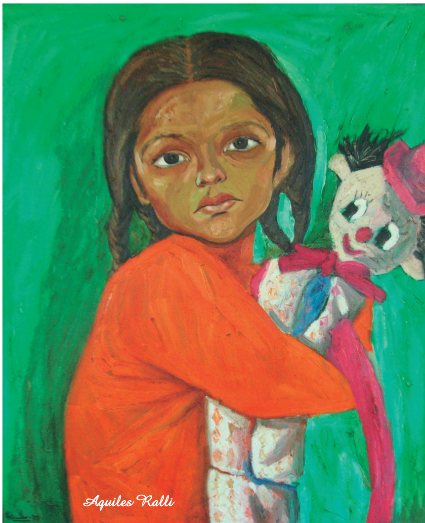
Paulita Óleo sobre lienzo, 88 x 74 cm.