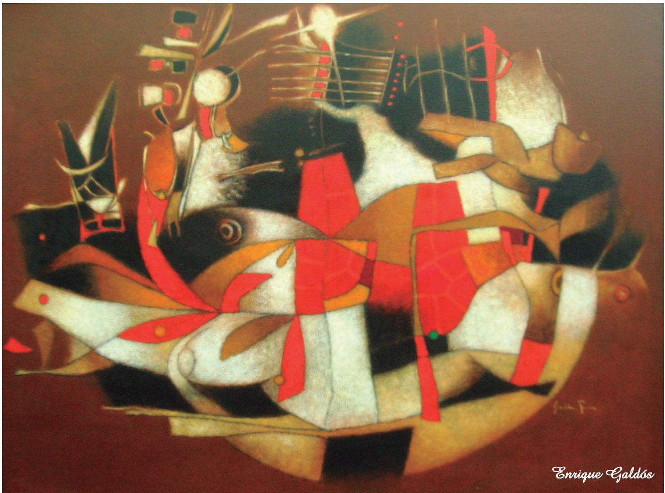
Arca de colores Óleo sobre lienzo, 120.5 x 160 cm.