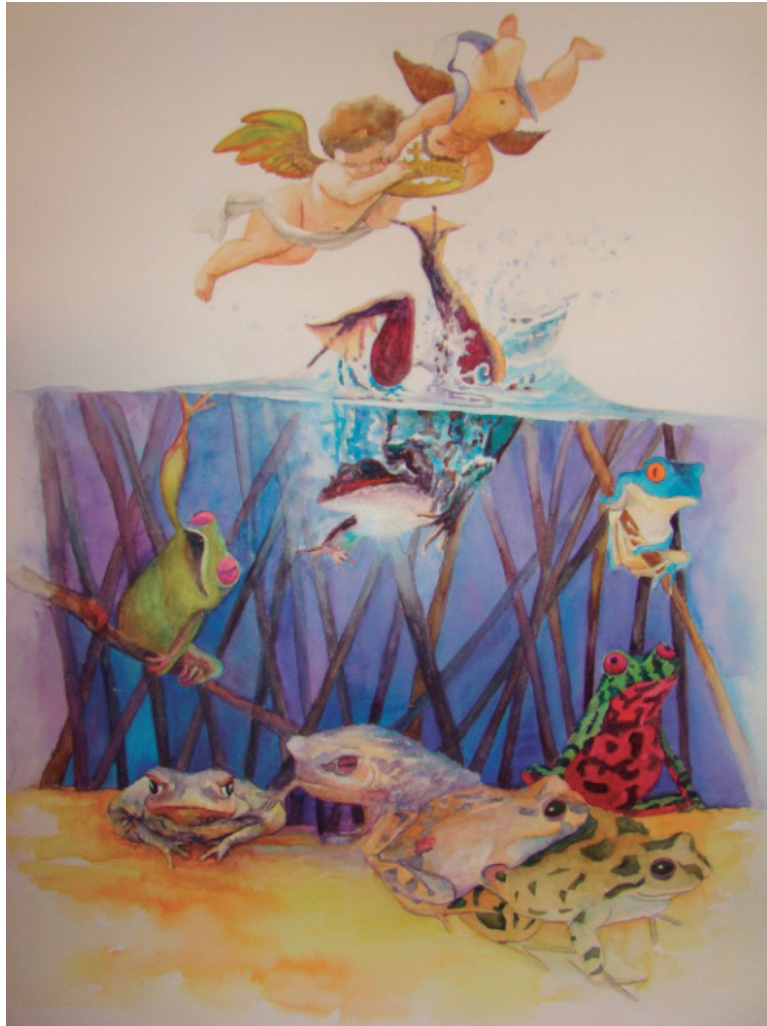
La santificación del sapito clo, clo Acuarela, 75 x 60 cm.