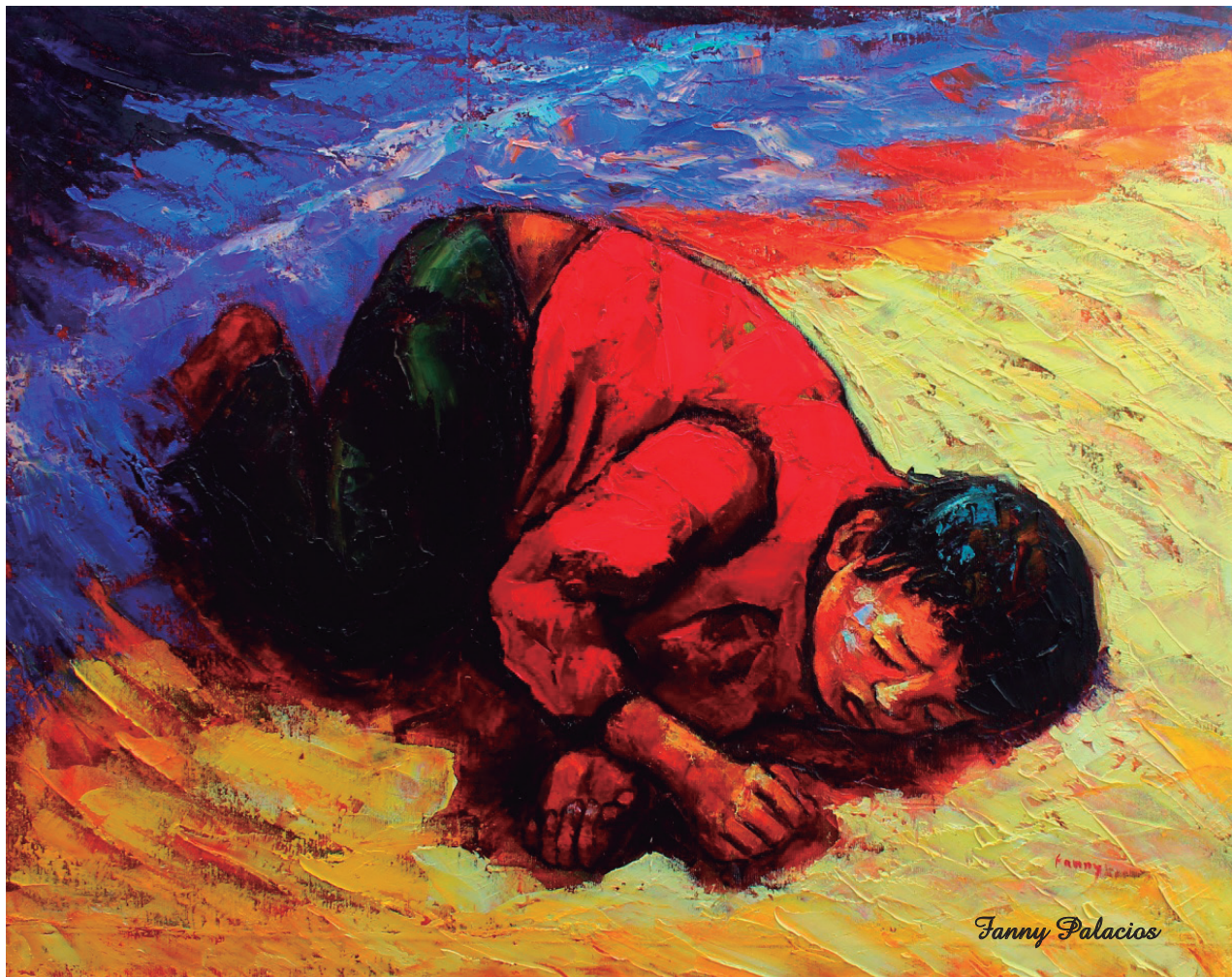
Siria Óleo sobre lienzo, 120 x 92 cm.