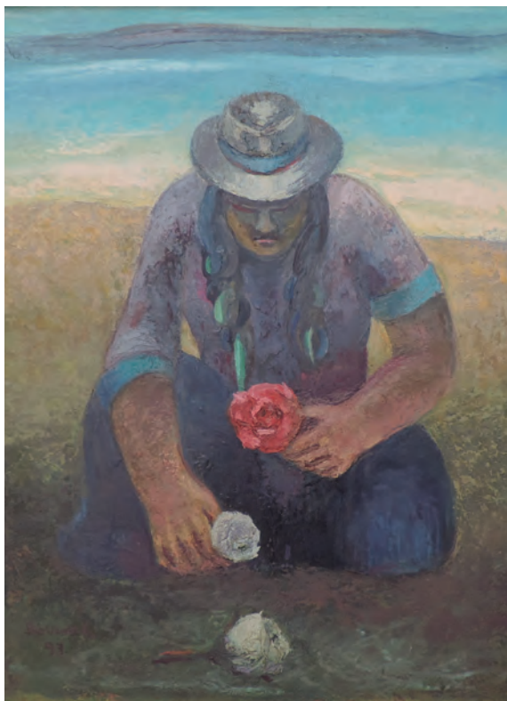
Rosa paz, rosa vida, óleo sobre lienzo

Otro tema constante en su trabajo plástico hasta el final de sus días fue su tierra natal Huaripampa.