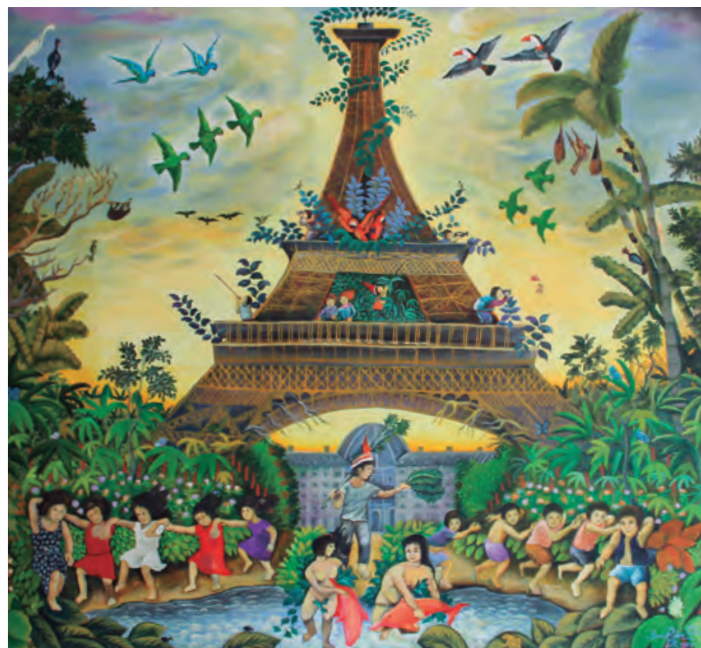
Brus Rubio Churay Pasaporte amazónico Acrílico sobre tela