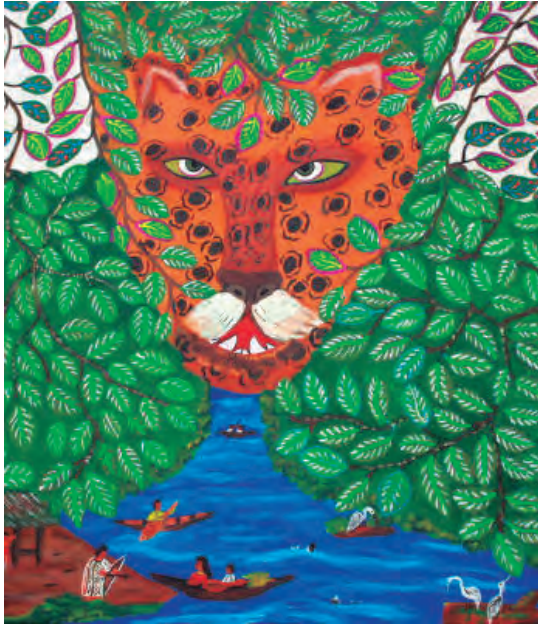
Harry Pinedo Inin Metsa May (shipibo-konibo) El protector Acrílico sobre tela