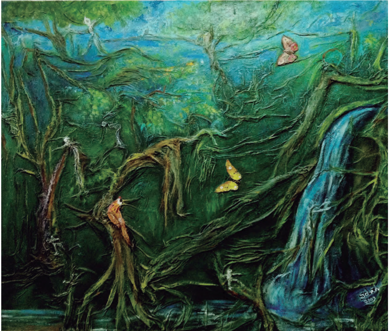
Sofía Lamadrid, Encanto de bosque, óleo sobre lienzo