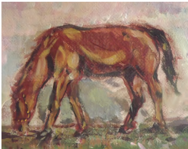
Luis Ninaquispe Machado El paso al jaral Acrílico sobre papel