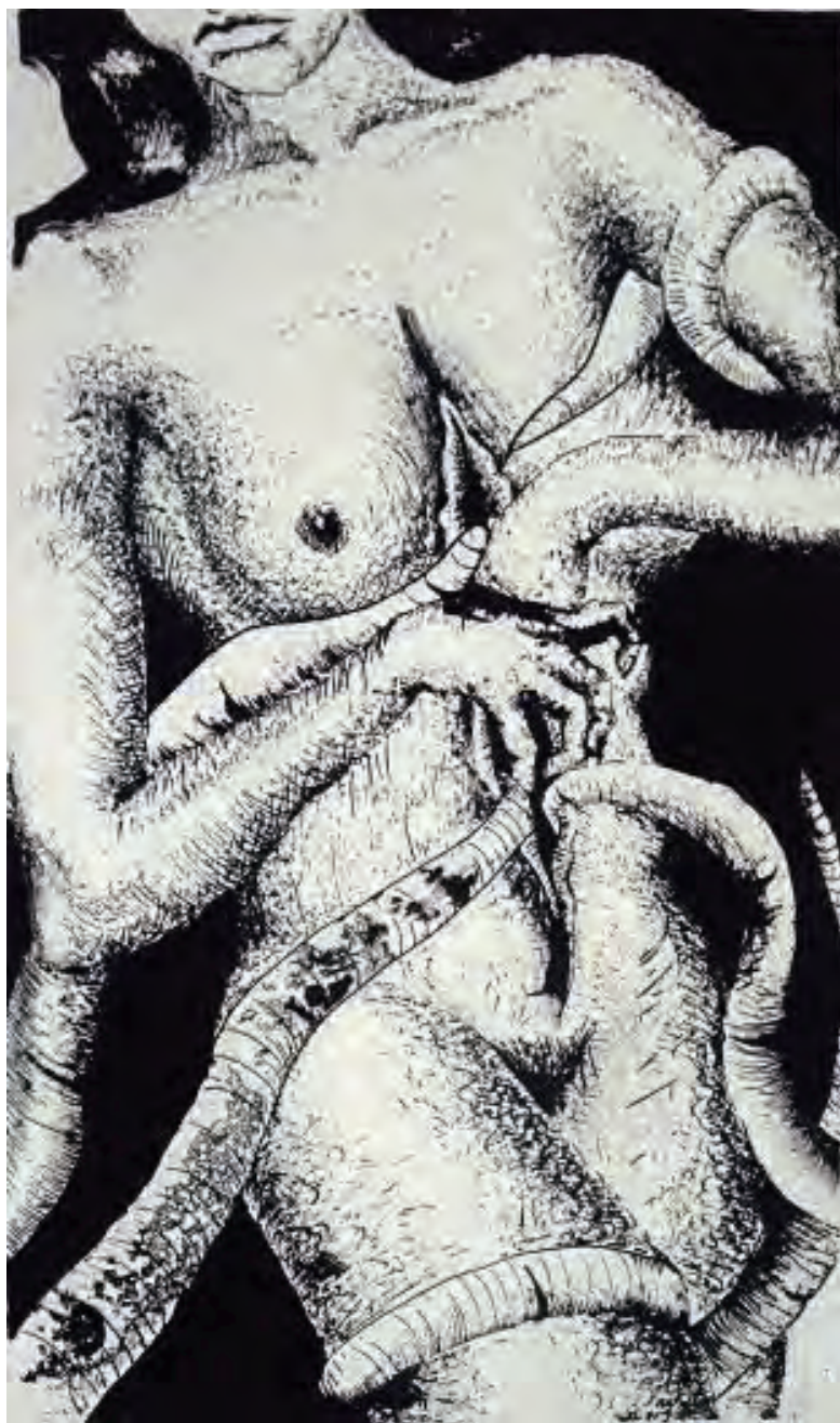
Carla Ollero, Lo que tú quieras, litografía a la plumilla