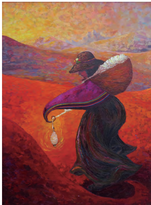
Enid Arestegui Mattuti La migración Óleo sobre lienzo