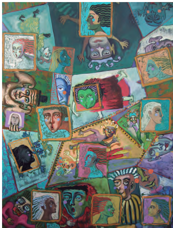
Edgar Aguirre Gesticulaciones II Técnica mixta sobre lienzo