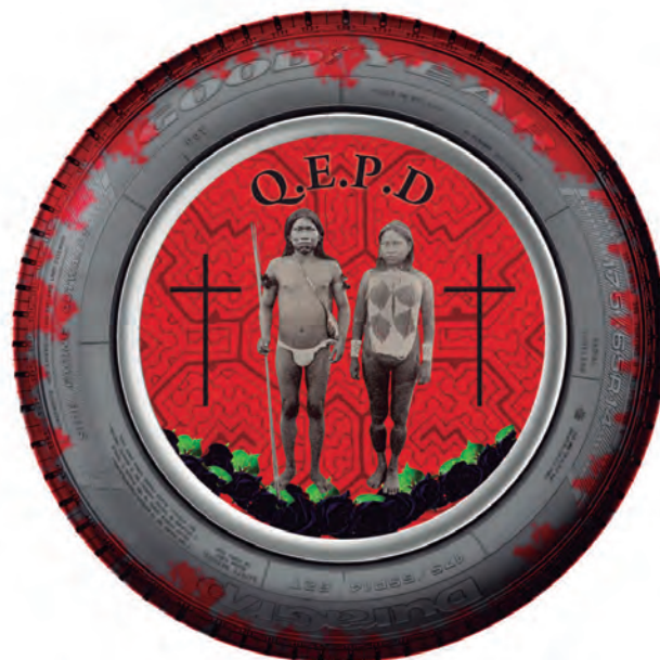
Alfonso Rodríguez Angulo Caucho I Técnica mixta / intervención sobre llanta