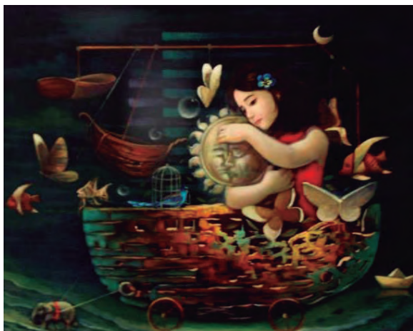
Willy Anicama Zamora Páramo de resiliencia Óleo sobre lienzo