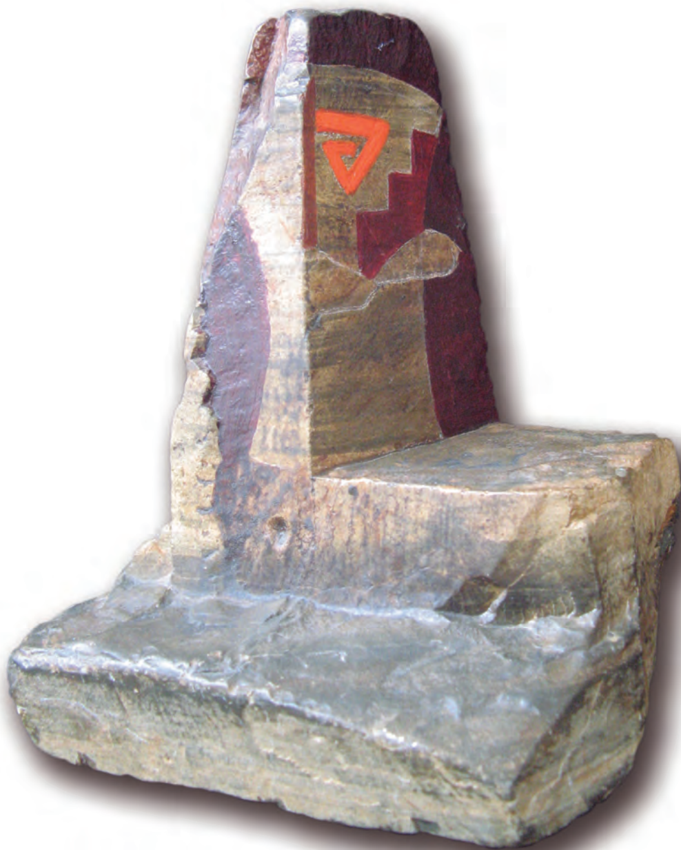
Gustavo Puente, Inti Watana, óleo sobre roca de Muruhuay-Tarma