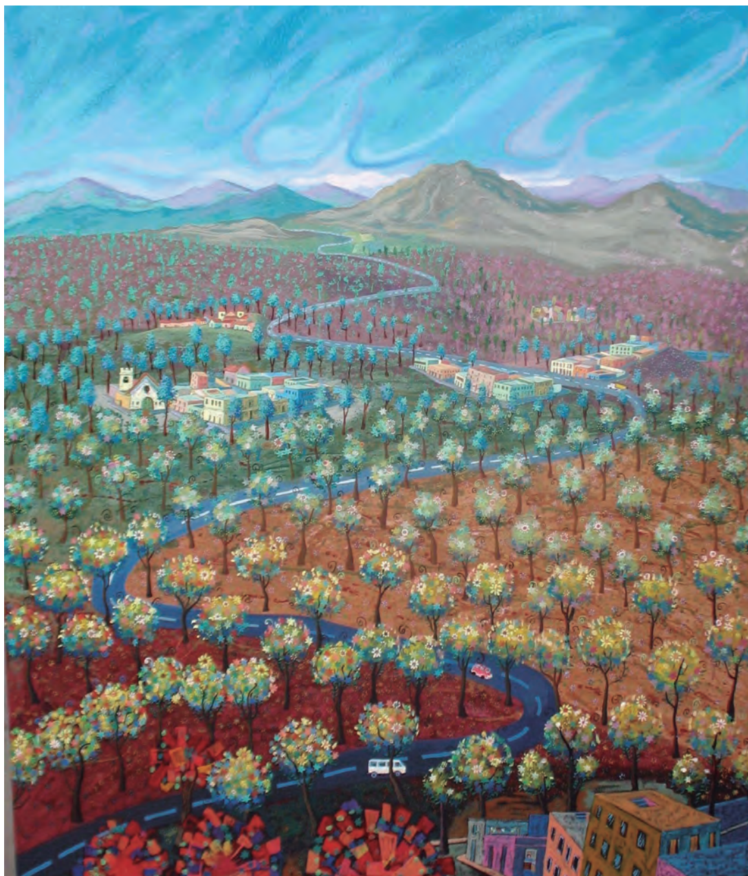
Edgar Aguirre, En algún lugar de un gran país, técnica mixta sobre lienzo