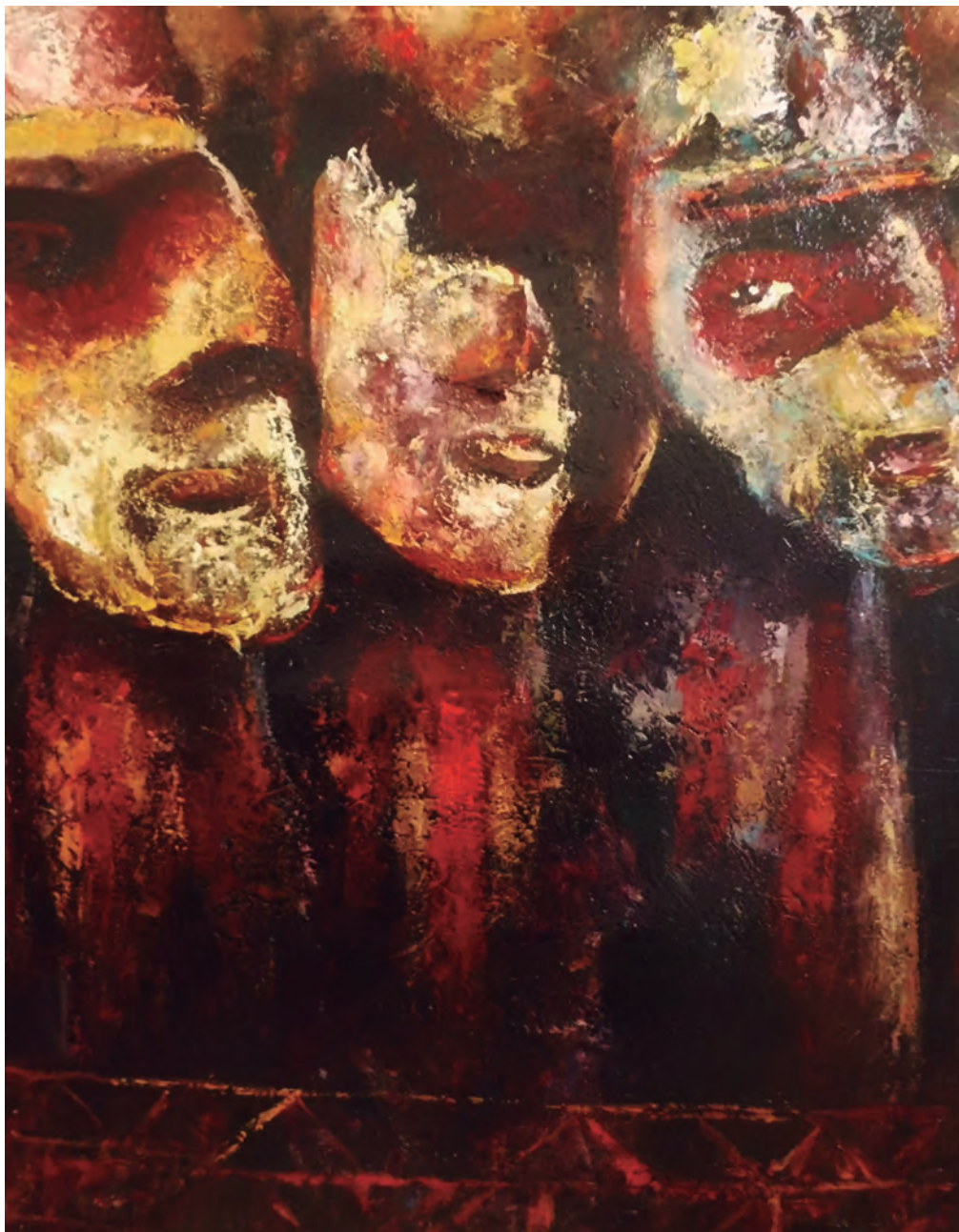
Carmen Rodríguez, Kuelap, óleo sobre lienzo