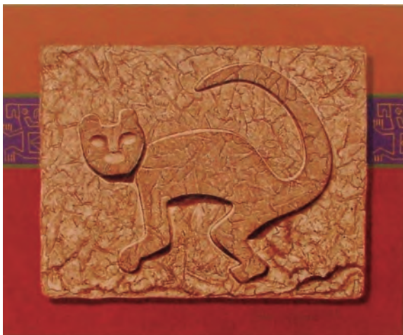
Tuko Zegarra Puma Chacha I Técnica mixta