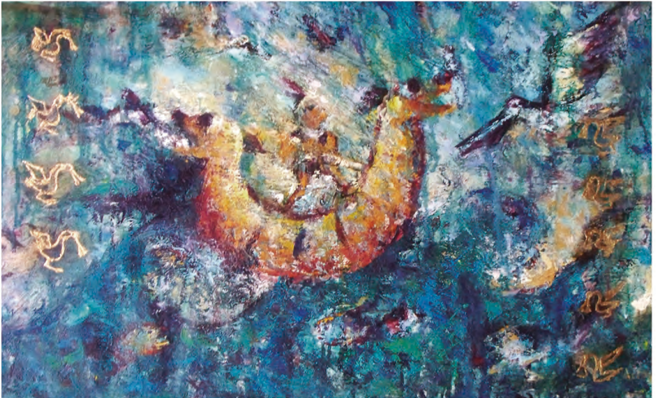
Carmen Rodríguez, Que las aves te acompañen, óleo sobre lienzo