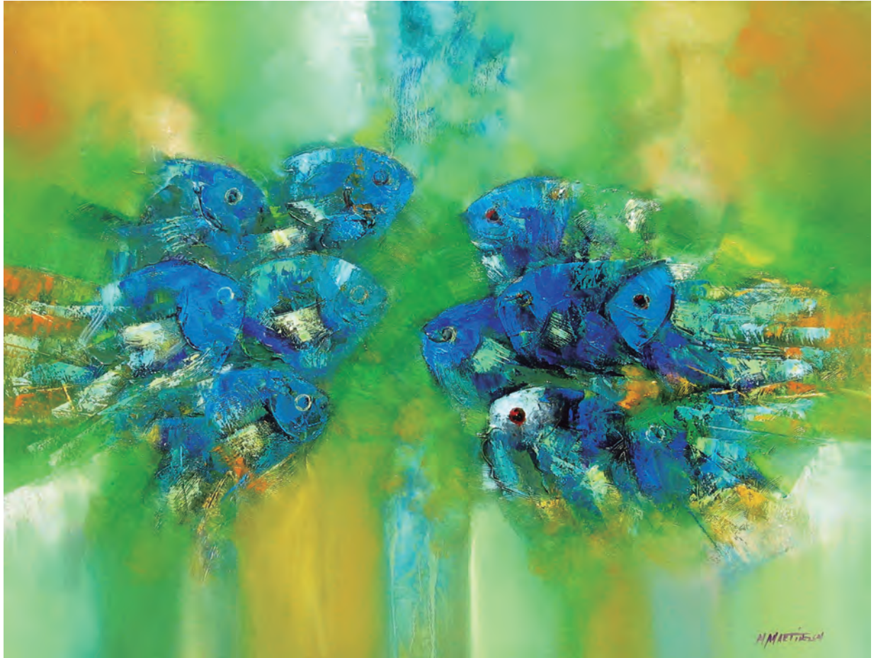
Manolo Martínez, Peces, óleo sobre lienzo