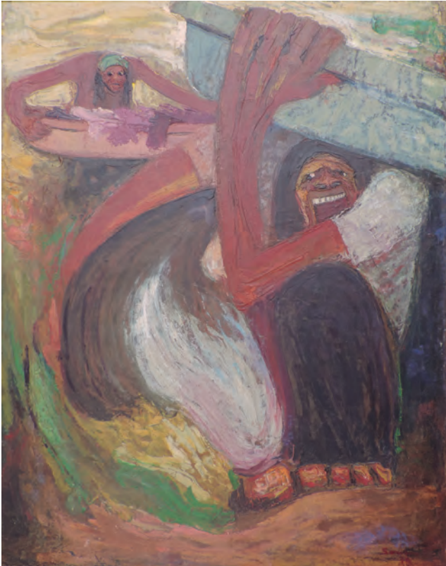
Lavandera Óleo sobre lienzo