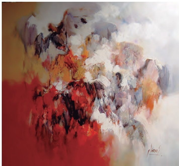
José Márquez Caisahuana Revoloteo Óleo sobre lienzo