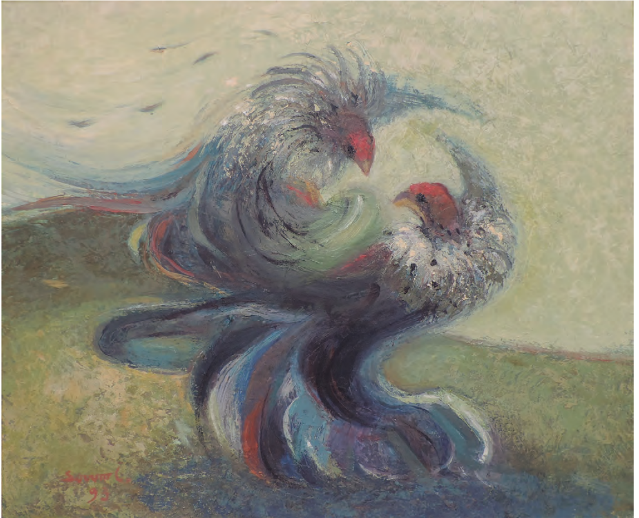
Fernando Sovero, Pelea de gallos, óleo sobre lienzo