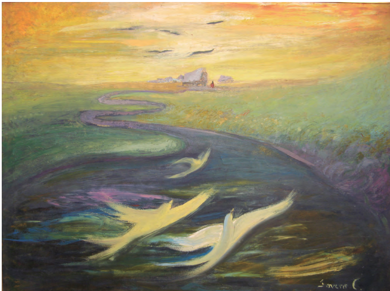
Fernando Sovero Cuyubamba, Las gaviotas, óleo sobre lienzo