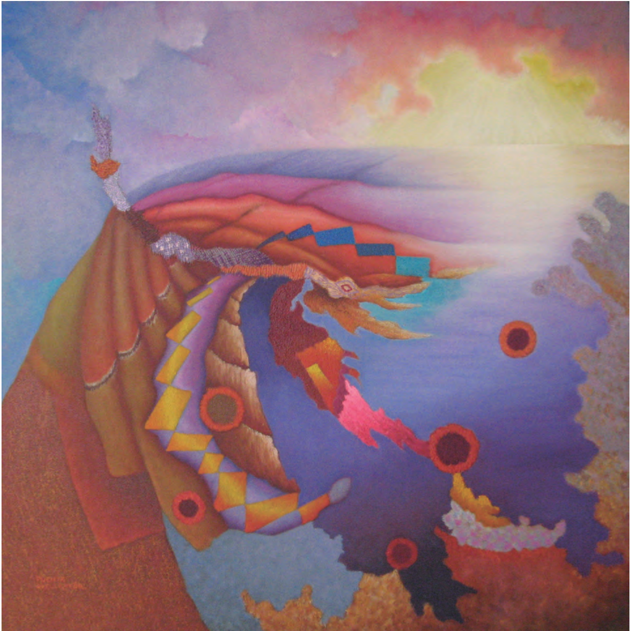
Gustavo Puente, Mar y Posa, óleo sobre lienzo