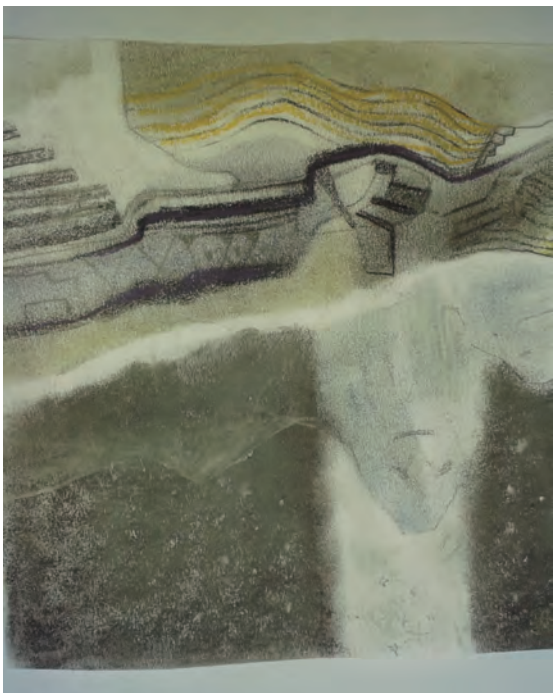
Miguel La Chira Cronómetro del espacio Óleo sobre lienzo