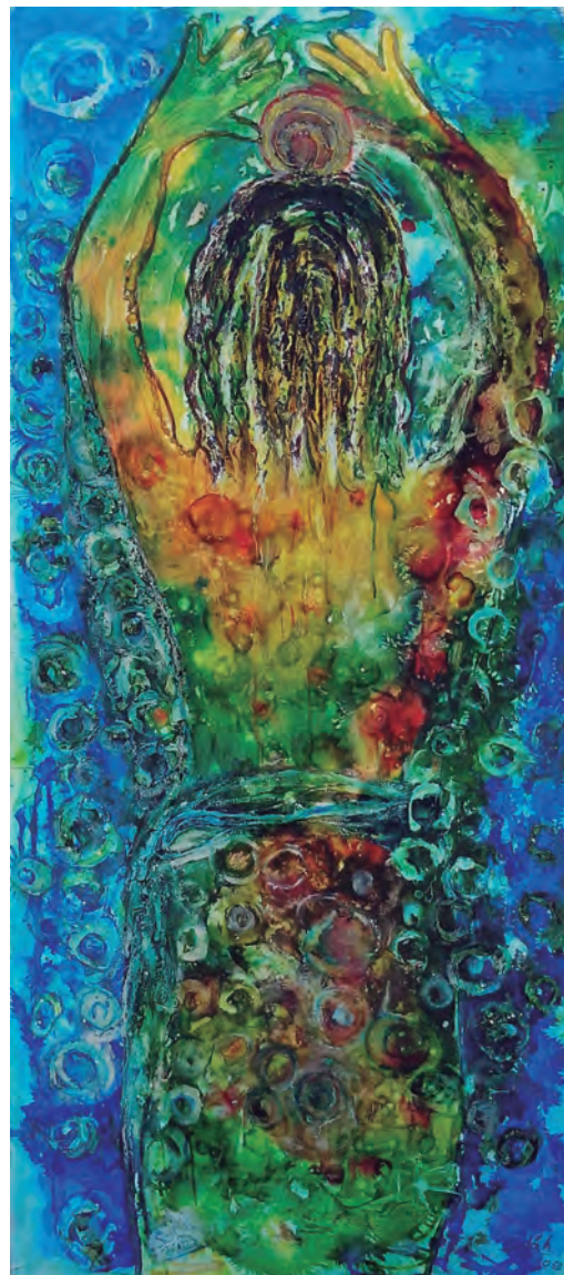
Sofía Lamadrid, Flotando en energía espiritual, técnica mixta sobre lienzo

Ha expuesto en la Casa de la Cultura del Chimborazo, Ecuador y en la Casa de la Cultura Ecuatoriana de Quito en el 2004. Seleccionada en el VII Coloquio Internacional de Arte Digital en Cuba, en el año 2005. Muestra Internacional Itinerante de Arte “MIAD - VENADO TUERTO” (julio, 2006) en Argentina. Ha participado en la Tercera Exposición de Artistas Plásticos de la Región Piura en la Universidad Nacional de Piura, 2013, y en la exposición colectiva “Ocho pintores” en homenaje a la distinguida artista piurana Lis Pérez León (2013), entre otras.