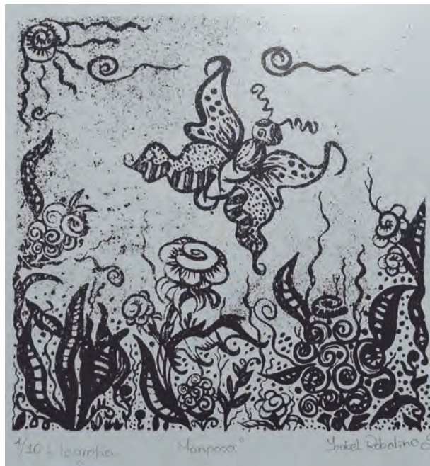
Ysabel Robalino Sánchez Mariposa Litografía 1/10.