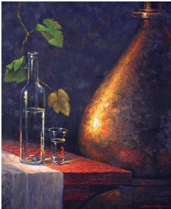
Percy Gavilán Pasión del pisco II Óleo sobre lienzo