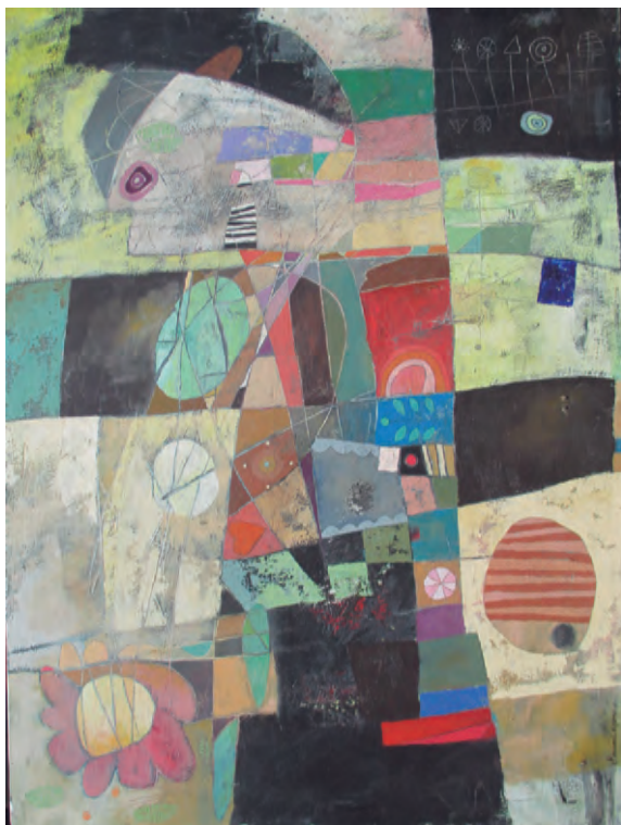
Miriam Chipana Construcciones Técnica mixta sobre lienzo