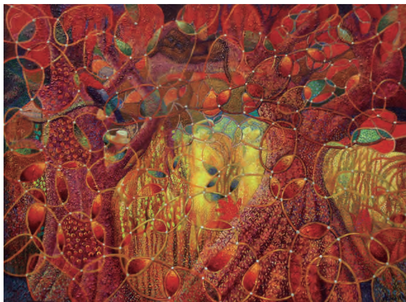
Walter Anicama Gómez Materia, espíritu y tiempo Óleo sobre lienzo