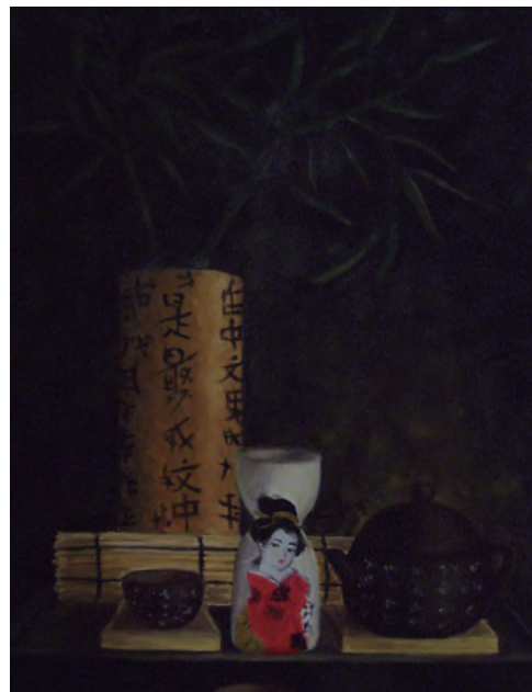
Torres Oliva, Sandra Bodegón oriental Óleo sobre lienzo