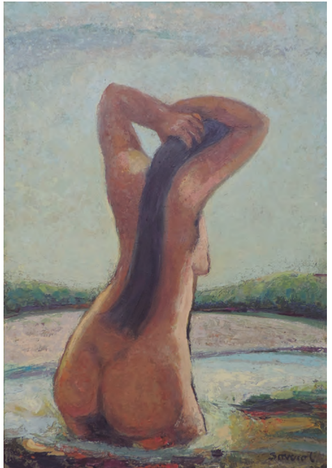
Bañista I Óleo sobre lienzo