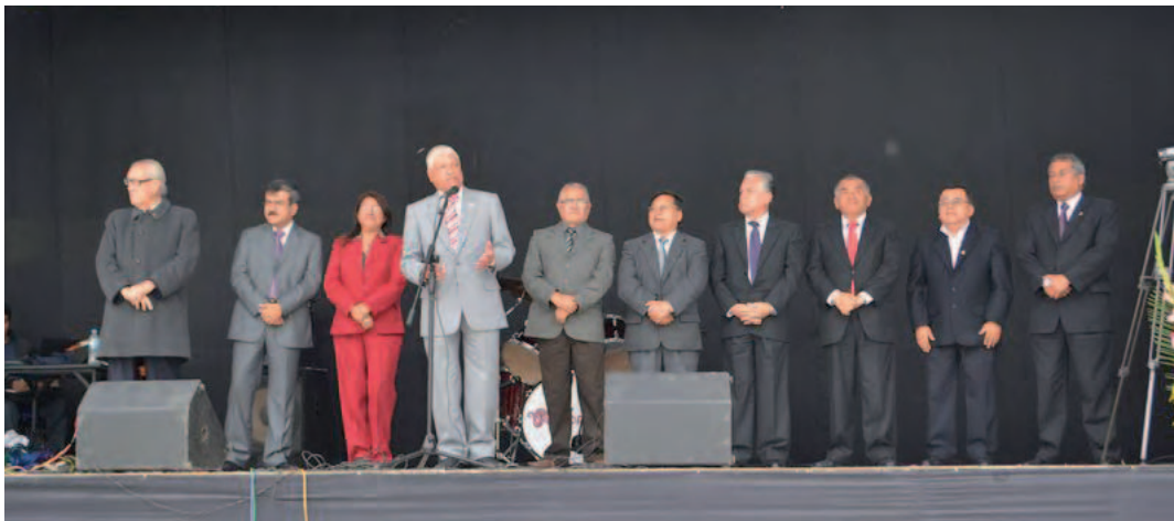
Bienvenida a Ingresantes 2012

La comisión de Bienvenida a los Ingresantes 2012 y 2013-I estuvo presidida por el Vicerrectorado Académico