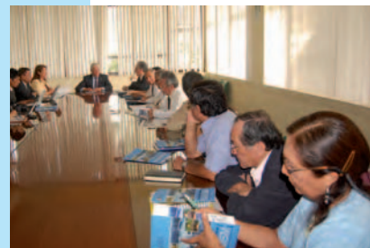
Presentación del Plan Estratégico Institucional 2012-2021.