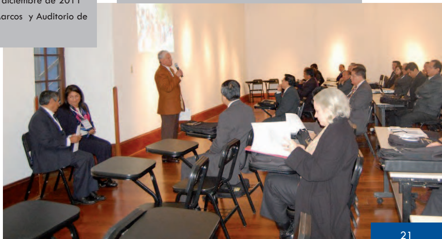
Participación de la Asamblea Universitaria en la Primera Jornada Universitaria.